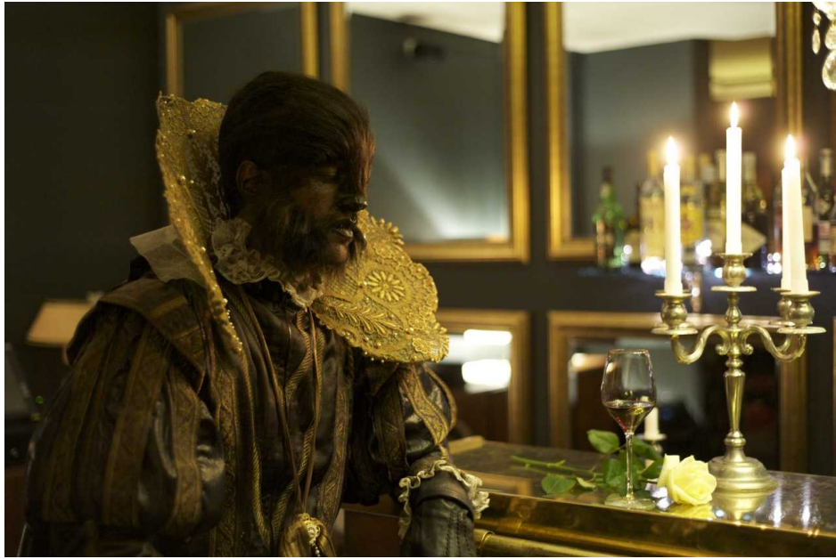
Pierre Joseph, La bête (Réactivation) , 2011

"Un certain nombre d'artistes investissent des territoires où le trash et la violence contribuent à enquêter sur les limites du corps. Ces tentatives participent à la consécration blasphématoire d'une esthétique nouvelle, cathartique dans laquelle le corps crie pour un acte transgressif. Ces actions scandalisent, provoquent et composent un voyage autobiographique révélant les névroses et les désirs dans une expérience sensible qui ne se contente pas d'être l'objet critique d'une société. Performance, théâtre, photographie, vidéo et autres média restituent ces indices attestant la présence d'un corps insoumis et incompris laissant présager la force d'un geste, d'une échappée. Si la création rime, semble-t-il, avec un désir de liberté sans limite, son caractère transgressif se manifeste par des chemins multiples, variables et désorientés.