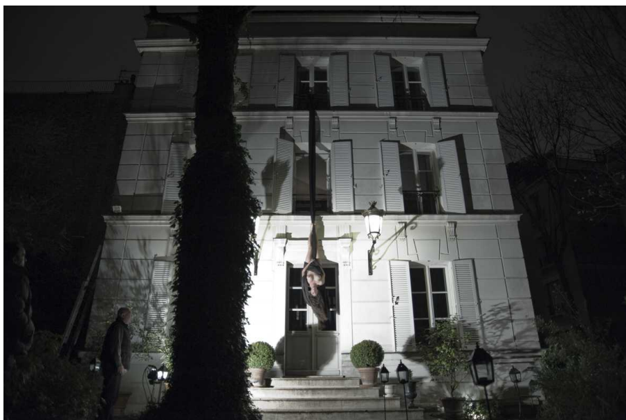
Sarah Trouche, Performance, Hôtel Particulier Montmartre, 2010, Photo: Trouche/Herr